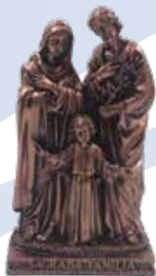
30 cm B/. 38.00