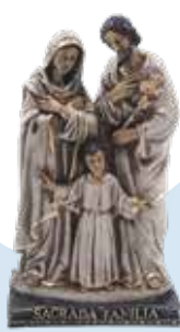
30 cm B/. 39.95