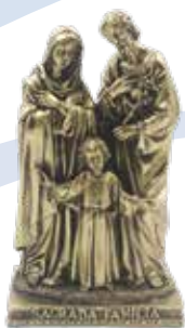
30 cm B/. 38.00