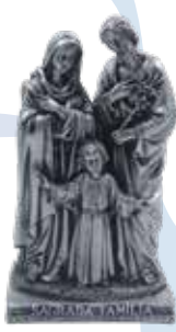
30 cm B/. 38.00